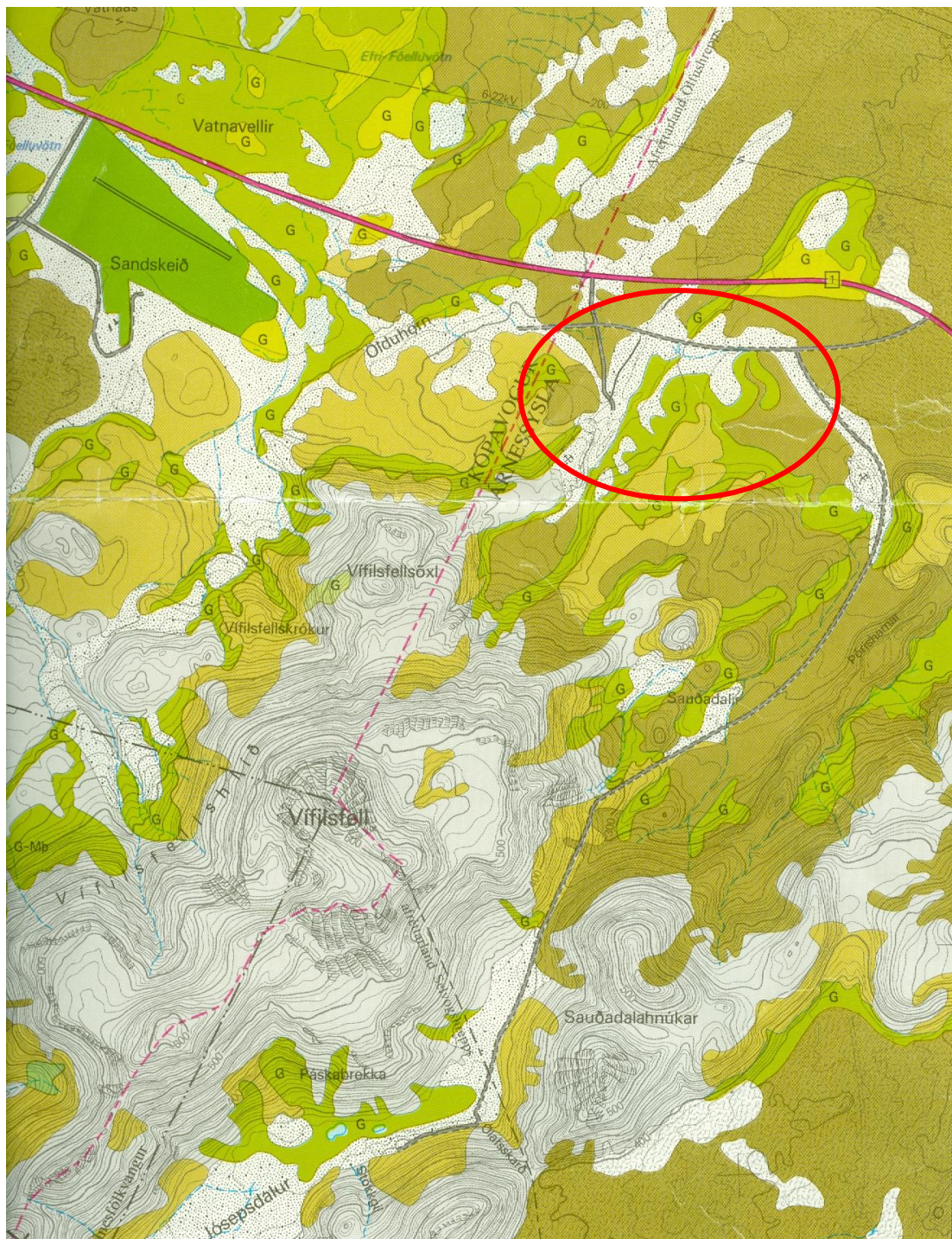
Mynd 5-4. Gróðurkort Vífilsfell 1613 III SA. Umrætt svæði er innan rauða hringins á myndinni.

Gróðurkort af svæðinu (mynd 4.3.) sýnir gróðurþekju svæðisins þar sem sjá má að stærsti hluti svæðisins er mosapemba, graslendi og sandur. Lykill að kortinu má sjá á mynd 4.3.