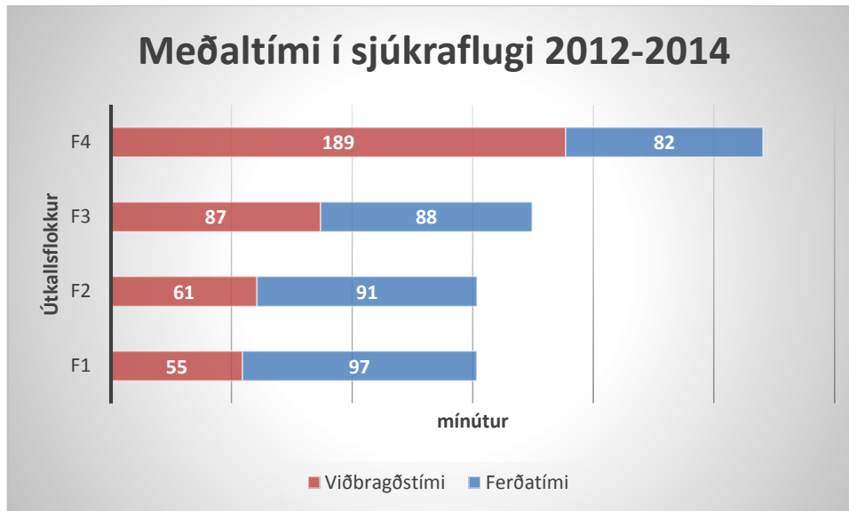
Mynd 3 Meðaltími í sjúkraflugi (mín) 2012-2014 skipt upp í viðbragðs- og ferðatíma eftir tegund útkalls

Á mynd að ofan má sjá hvernig meðaltími í sjúkraflugi 2012-2014 skiptist í viðbragðstíma (frá beiðni til flugtaks) og ferðatíma. Rétt er að taka fram að viðbragðstími í samningi um sjúkraflug er skilgreindur sem sá tími frá því að beiðni um sjúkraflug berst þar til flugvél er tilbúin til flugtaks. Í útreikningum á viðbragðstíma að ofan er tíminn frá því að vél er tilbúin til flugtaks og þar til flugtak á sér stað einnig innifalinn.